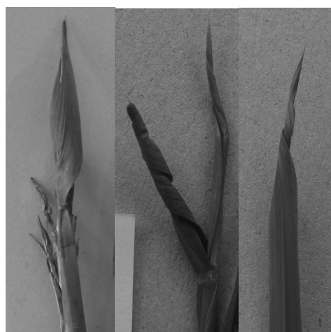
Mép lá xoắn vặn