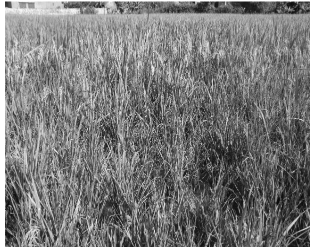
Lùn sọc đen, sọc đen dọc theo lóng thân