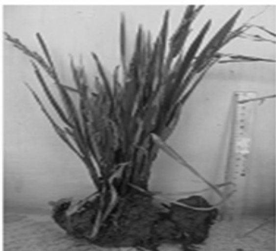
Bụi lúa bị bệnh có màu xanh đậm

Từ giai đoạn làm đòng và khi lúa có lóng, cây bị bệnh thường nảy chồi trên đọt thân và mọc nhiều rễ bất định. Trên bẹ và lóng thân xuất hiện nhiều u sấp và sọc đen. Khi bị bệnh nặng cây lúa không trở bông được hoặc trở bông không thoát và hạt thường bị đen. Ở giai đoạn trở bông, triệu chứng bệnh có thể xuất hiện ở tất cả các danh trên cùng một khóm, hoặc chỉ ở một số danh, các danh khác vẫn phát triển bình thường.